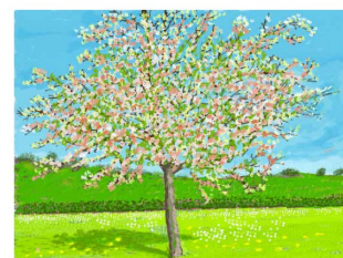
2024-APR 2025, 2025 Peinture sur iPad montée avec l'armature 2024-APR 2025, No. 1, 2025 Peinture sur iPad montée avec l'armature