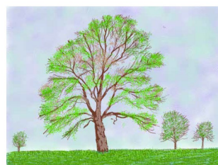
2024-APR 2025, 2025, 2025 Peinture sur iPad imprimée sur papier, montée sur aluminium, 73,8 x 103,8 cm