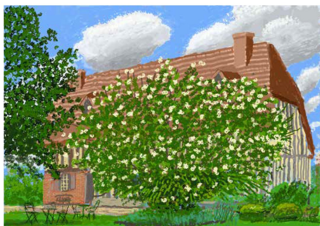
2024-APR 2025, 2025 Peinture sur iPad imprimée sur papier, montée sur aluminium, 73,8 x 103,8 cm

Rédigé par des historiens de l'art et des commissaires d'exposition de renom, dont Norman Rosenthal, Suzanne Pagé, Simon Schama, Donatien Grau, Eric Darragon, James Cahill et Fiona Maddocks, ce volume de référence propose une sélection soigneusement organisée de plus de 400 œuvres de Hockney, couvrant une période allant de 1955 à 2025. Grâce à son grand format paysage et à ses dépliants intégrés, il permet de redécouvrir sous un nouveau jour certaines des œuvres les plus emblématiques de l'artiste.